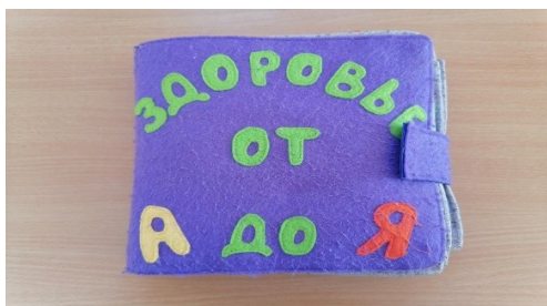
Книга из фетра